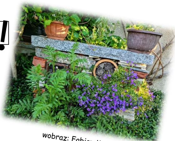
wobraz: Fabian Korch